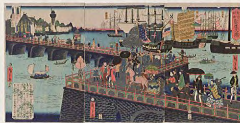
ロンドンを描いた錦絵「英吉利西龍道大港」文久2年(1862)