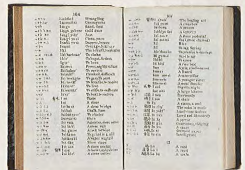
最初期の英和・和英辞書

メドハースト "An English and Japanese and Japanese and English Vocabulary" 1830年