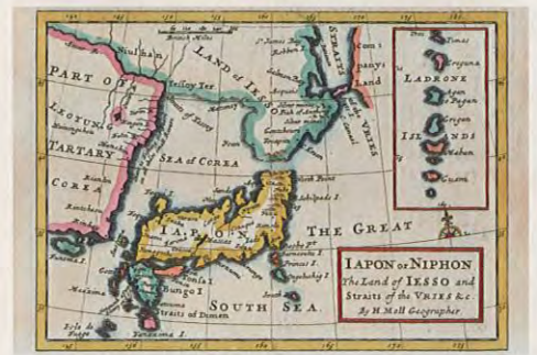
ロンドンで発行された日本地図 "Japon or Nippon" 1712年