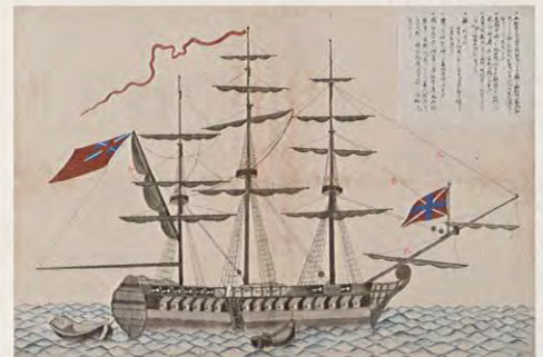
浦賀に来航した捕鯨船サラセン 文政5年(1822)